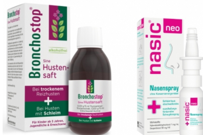
Abbildung: Die Klosterfrau Healthcare Group führt seit Oktober 2020 neue Produkte im Erkältungssegment ein: Bronchostop Sine Hustensaft (I.) und Nasic Neo

Bei dem ebenfalls neuen Bronchostop Sine Hustensaft handelt es sich laut Hersteller um ein pflanzliches Arzneimittel, das sowohl bei trockenem Reizhusten als auch bei produktivem Husten einsetzbar ist. Klosterfrau vertreibt das Produkt seit Oktober 2020 exklusiv in Apotheken und Versandapotheken.