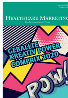
Bestellung | Sonderhefte-Archiv